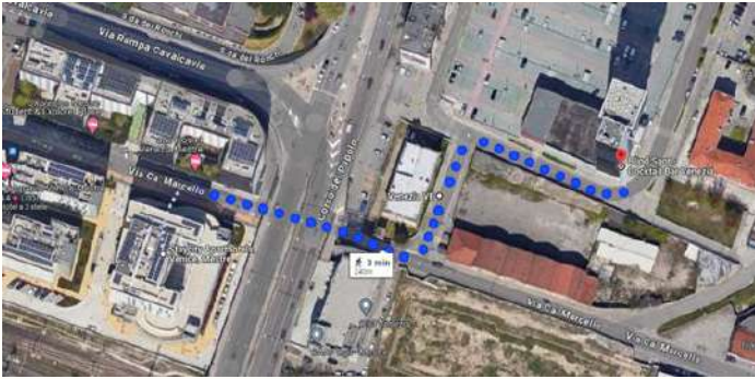
Come raggiungere il Blind Spot Mestre da StayCity ApartHotels