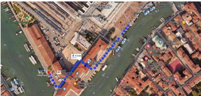
Percorso da Venezia S.Lucia al punto di approdo battello riservato